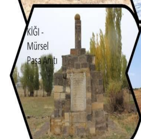
KİĞİ - Mürsel Paşa Anıtı