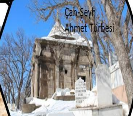
Çan Şeyh Ahmet Türbesi