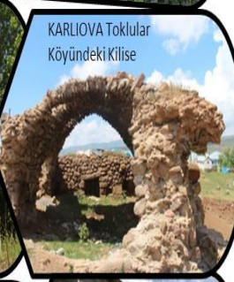
KARLIOVA Toklular Köyündeki Kilise