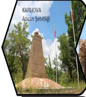
KARLIOVA Azizan Şehitliği