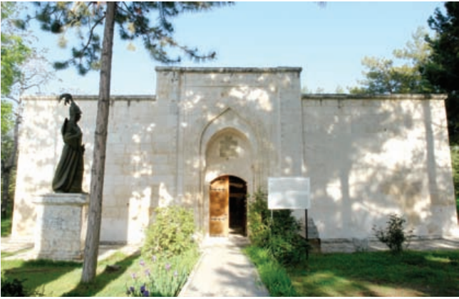
* Gazi Ertokuş Medresesi

Medrese, I. Alaaddin Keykubat zamanında, Selçuklu kumandanlarından Mübarizeddin Ertokuş tarafından 1224 yılında yaptırılmıştır. Medresenin taşları Agrai (Atabey) ve Seleukeia Sidera (Bayat) harabelerinden getirilmiştir. Medrese "Kapalı Tip Medrese" türüne girer ve dış avlu, iç avlu ile türbe ve medrese odalarından oluşur. Medresenin hücreleri zemin katta olup, üzerleri kubbelidir. İç avluda bir havuz ve üstünde ortası açık bir kubbe vardır. Bu kubbe