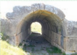
* Seleukeia Sidera Antik Kenti

Atabey'e giderken Bayat Köyü yakınında bulunan kentin Seleukos Kralı, I. Seleukos Nikator (MÖ 312-280) ya da oğlu I. Antiokhos Soter (MÖ 280-261) tarafından kurulduğu düşünülmektedir. Kentin adı İmparator Cladius döneminde Claudia Seleukeia, M.S. 7. yüzyılda Seleukeia Sidera olmuştur.