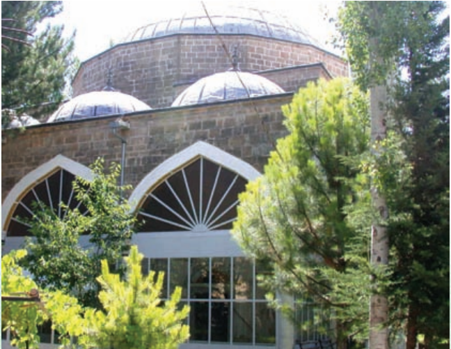
* Sinan Camii (Kurşunlu Camii)

Mimar Sinan stiliyle 1591 yılında yapılmıştır. Tek kubbeli olan yapının kubbesi kurşun kaplıdır. Caminin minaresi, basamak merdiveni, orta direk ve dış duvarının bir bütün olarak oyulduğu kasnakların üst üste dizilmesiyle meydana gelmiştir.