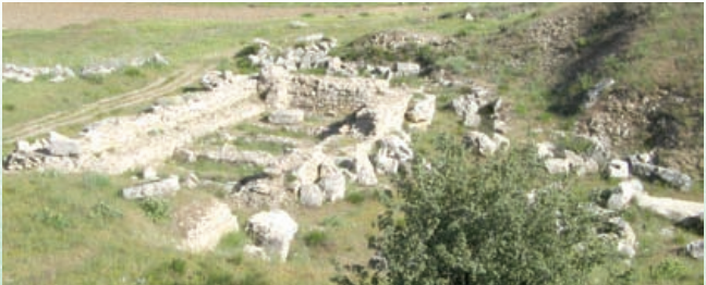
* Seleukeia Sidera Antik Kenti