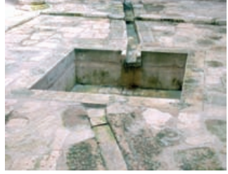
* Gazi Ertokuş Medresesi

yarım kemerlerle dört mermer direğe dayanmaktadır. Medresenin portalı ve yan nişleri, daha sonraki Selçuklu medreselerine göre daha sade bir tezyinatla işlenmiştir. Fakat bu sadelik içinde portal birkaç bordürle canlandırılarak olgun bir cephe tesiri yaratılmıştır. Medresede, büyüklük ve ahenk bakımından gerçekten az görülen tesire varılmıştır. Taş mihrabıyla Anadolu Selçuklu eserlerinin nadir örneklerindedir.