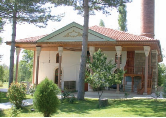
* Feyzullah Paşa Camii