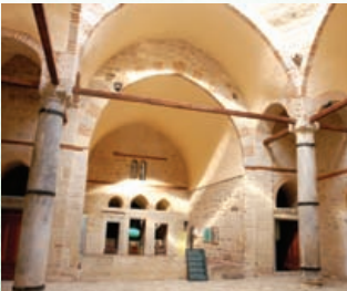
* Gazi Ertokuş Medresesi

Medrese, I. Alaaddin Keykubat zamanında, Selçuklu kumandanlarından Mübarizeddin Ertokuş tarafından 1224 yılında yaptırılmıştır. Medresenin taşları Agrai (Atabey) ve Seleukeia Sidera (Bayat) harabelerinden getirilmiştir. Medrese "Kapalı Tip Medrese" türüne girer ve dış avlu, iç avlu ile türbe ve medrese odalarından oluşur. Medresenin hücreleri zemin katta olup, üzerleri kubbelidir. İç avluda bir havuz ve üstünde ortası açık bir kubbe vardır. Bu kubbe